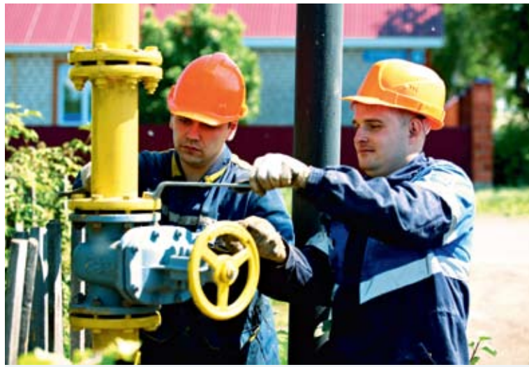
Работы по подготовке к зиме идут согласно графику

— Без сомнения, мы свои обязательства выполним в полном объеме. Обеспечение бесперебойной транспортировки голубого топлива, надежное газоснабжение потребителей региона в условиях зимних максимумов для нас остается главной задачей. На ее реализацию направлены все усилия, знания и опыт наших газовиков, современная производственная мощь компании. Да, летняя жара внесла определенные коррективы в ход под-