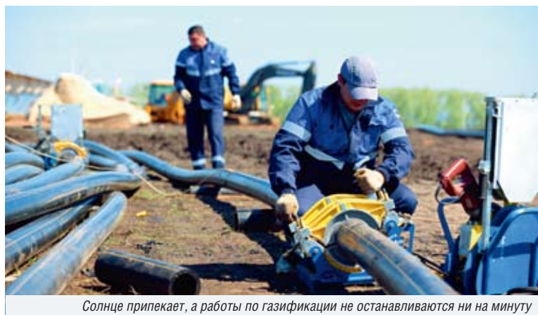
Солнце припекает, а работы по газификации не останавливаются ни на минуту

— Газопровод межпоселковый от ГРС Ново-Александровка до мкр. Затон Уфимского района протяженностью — 26 километров.