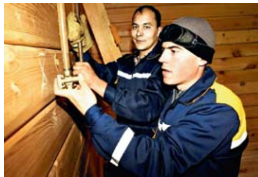
Газификация дома — наиболее надежный способ обеспечить стабильную работу системы отопления

— Первое, что было в наших планах по улучшению клиентоориентированности компании — создание «Единого центра обслуживания», чтобы потенциальный абонент, придя туда, мог сдать документы, заключить договор комплексного обслуживания и в разумный срок получить голубое топливо, а