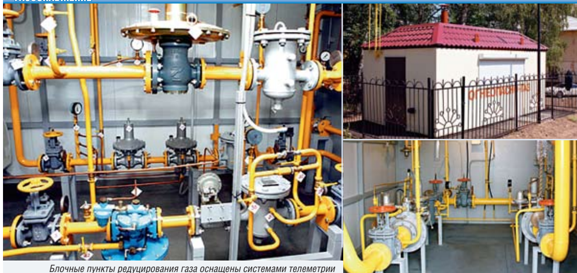
Блочные пункты редуцирования газа оснащены системами телеметрии