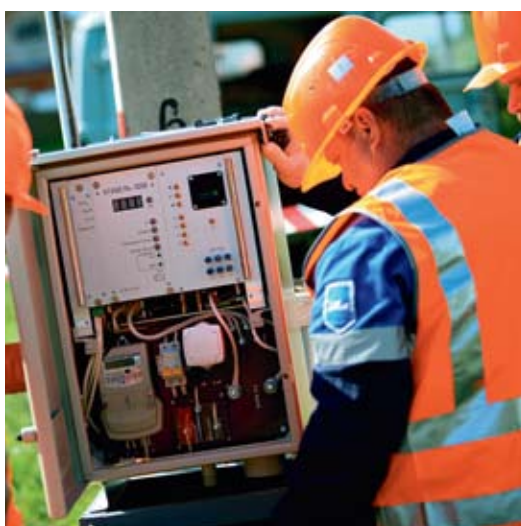
Проверка работы станции катодной защиты

Кроме того, мы изготавливаем необходимое оборудование, изделия и