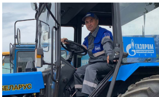
ОХОТА, НО БЕЗ ВЫСТРЕЛА