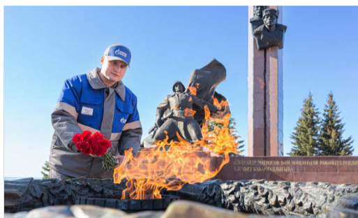
ПАМЯТЬ СВЯТО СОХРАНИМ