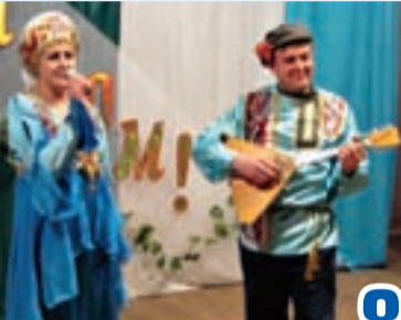
Духовное родство и гармония стр. 8