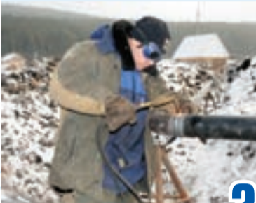
Вгрызаясь в скалы, идем в будущее стр. 2