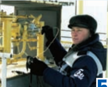
В краю ковыльных степей стр. 5