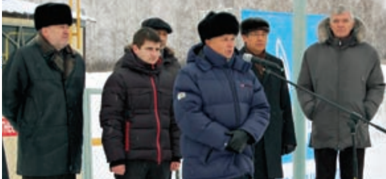
Газовиков сельчане встретили традиционным чак-чаком