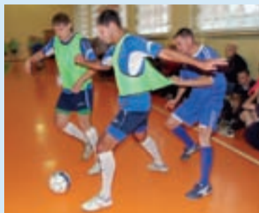
Наши футболисты показали превосходную игру