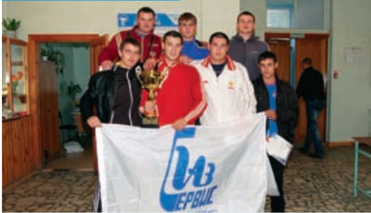
Великолепный «силовой блок» газовиков