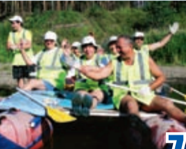
Край наш чудесный не любить нельзя стр. 7