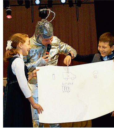
Во время акции детям было показано увлекательное представление о правилах безопасного использования газа

Специалисты рассказали о том, что необходимо знать при пользовании га-