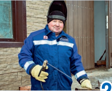
С синей молнией в руках