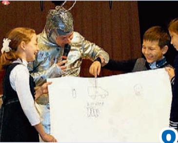
Чтобы газ грел, не обжигая