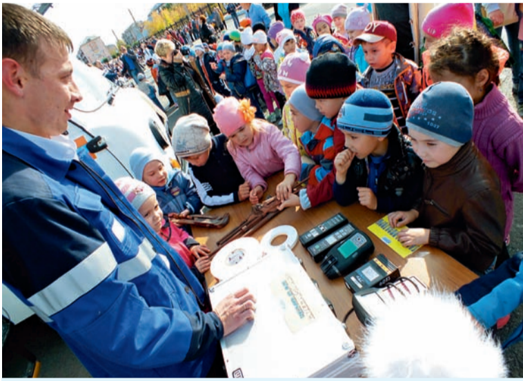
С каждой группой детей была проведена интересная беседа по безопасному использованию газом (Учалы)

Данное мероприятие надолго запомнится и детям, и взрослым и позволит лучше усвоить элементарные правила безопасности, о которых зачастую мы даже не задумываемся.