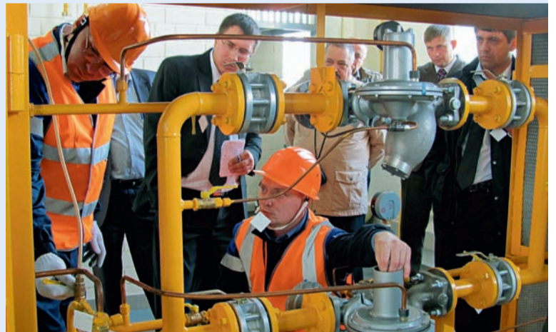
Практические занятия по техническому обслуживанию ШГП