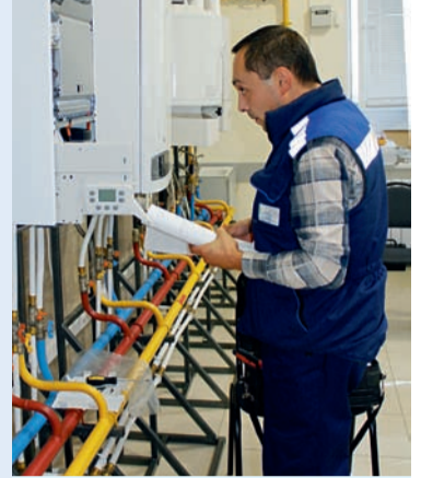
Отработка навыков по выявлению неисправностей газового оборудования с электронным управлением

— Для меня ОАО «Газпром газораспределение Уфа» — эта некая константа в жизни. У меня есть семья, есть друзья и есть «УЗЦ». Здесь во многом пригодились мой туристический опыт: быть мобильным, не стоять на месте, развиваться, быть всегда на шаг впереди, не бояться принимать решения и отвечать за них. Родители научили меня двум самым важным в жизни вещам — жить честно и быть свободным человеком.