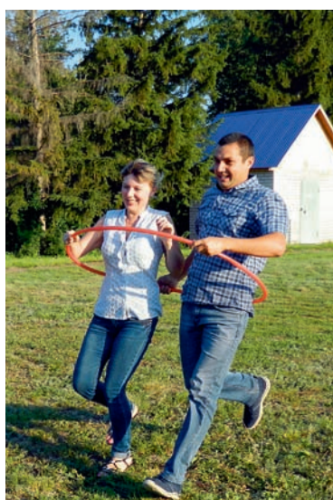
На семейных стартах веселились от души