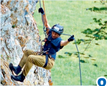
Жить в гармонии с природой