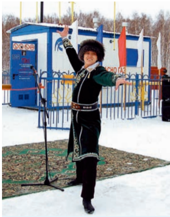
Дорогих гостей встречали хлебом-солью, народным танцем, а также песней, которую самодельные артисты посвятили газовикам